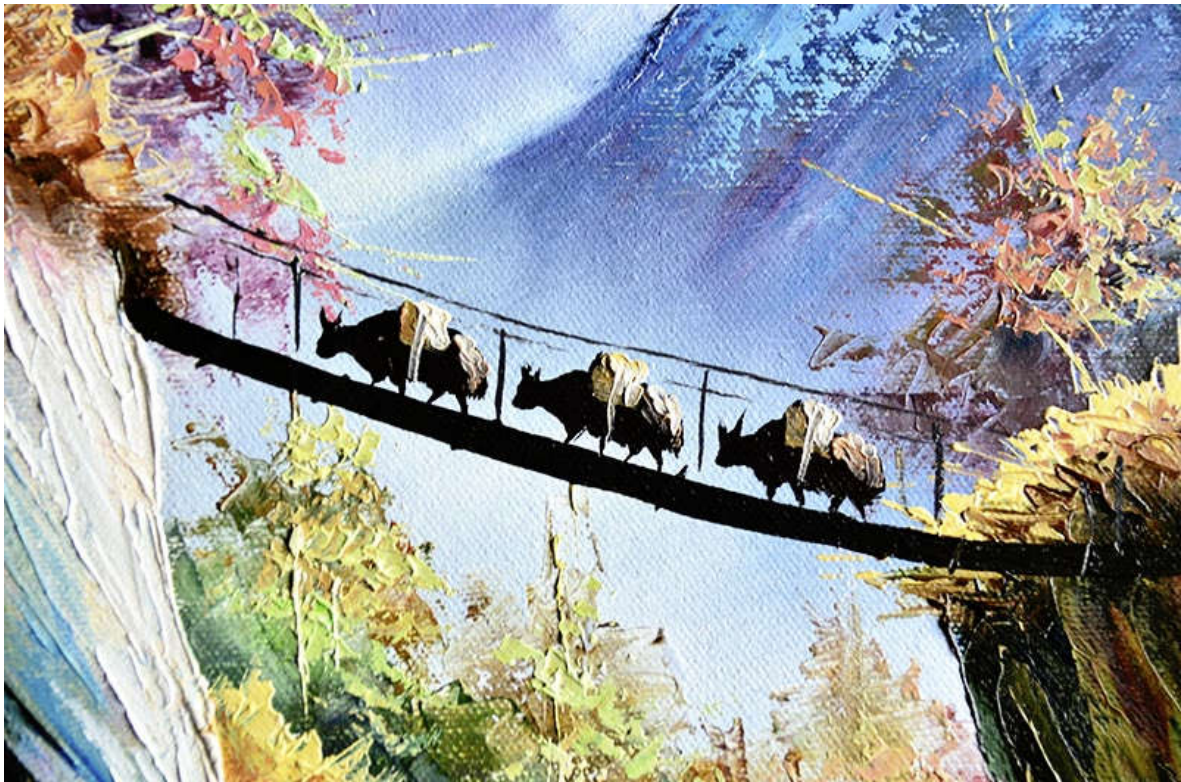
Yaks auf einer Brücke: Ausschnitt eines Ölgemälde

https://www.l-seifert.de/galerie/bilder.php