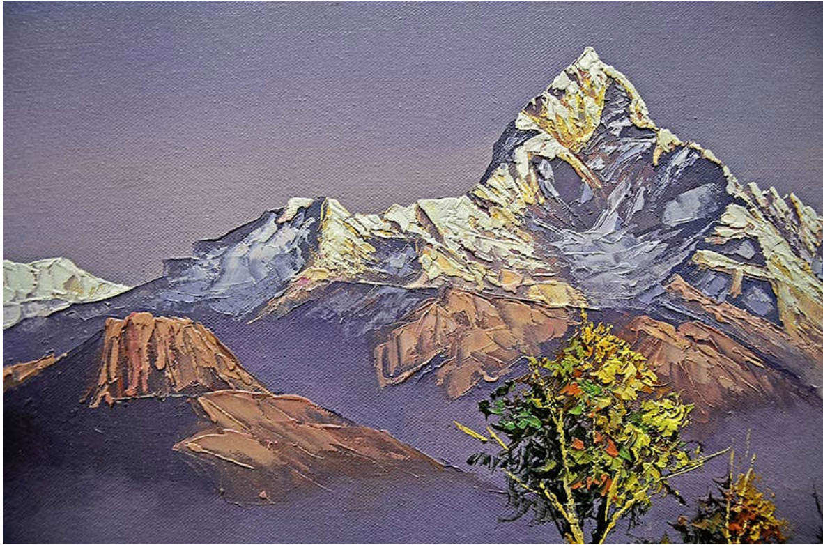
Machapuchare: Ausschnitt eines Ölgemälde aus Nepal