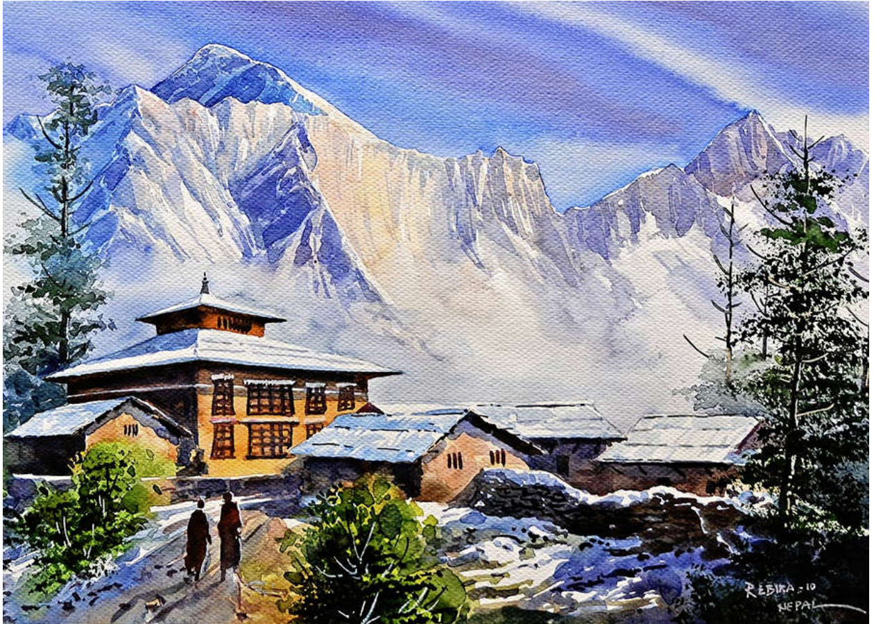
Kloster Tengboche Aquarelle