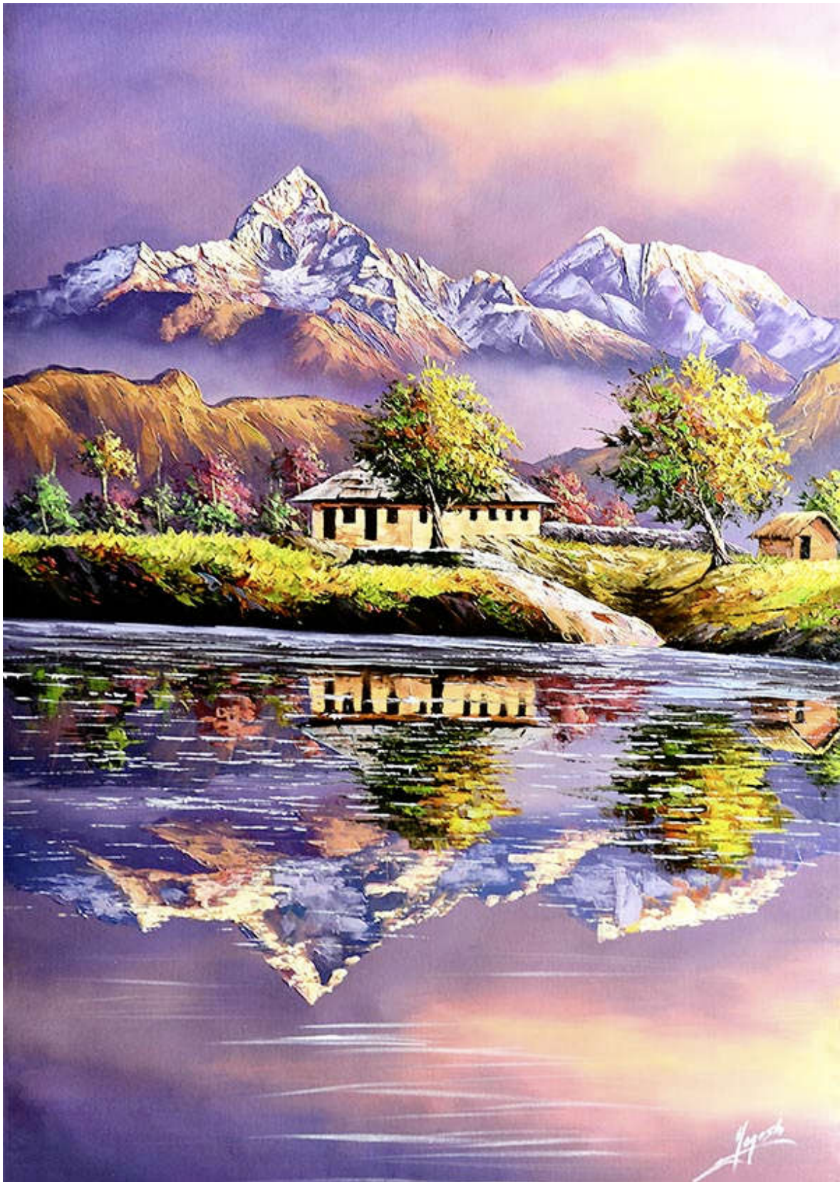
Der Fewa Lake in Nepal

Können diese Ölgemälde und Aquarelle auch Sie begeistern? Autor: Lothar Seifert https://www.l-seifert.de/